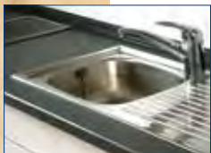
OTTOCOLL® M500 zum Kleben und Dichten von wasserbelasteten Fugen im Innenbereich.

OTTOCOLL® M500 verursacht keine Verfettung und ist somit für Marmor und Naturstein geeignet .